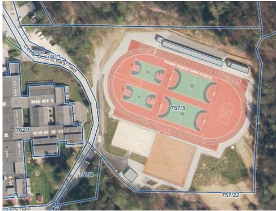
Slika 1: Skica parc. št. 757/3 k.o. 1810 - Stična, na kateri se nahaja gostinski lokal.

Skica, lokacija in tloris gostinskega lokala, ki je predmet oddaje v najem: