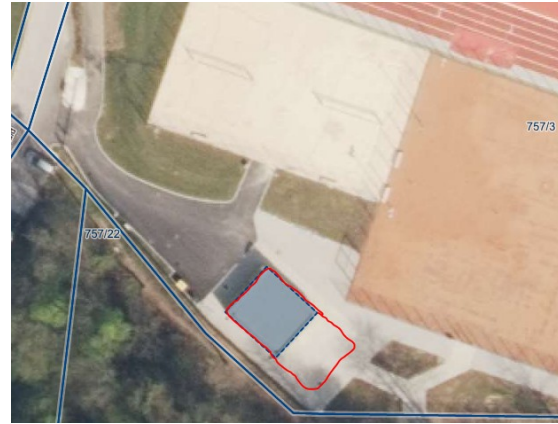
Slika 2: Lokacija stavbe št. 1790, kjer se nahaja gostinski lokal, ki je predmet oddaje v najem.